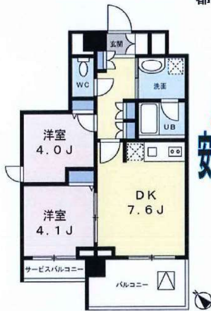
※図面と現況が異なる場合は、現況優先とします

☆電気・ガス・水道・インターネット☆ ライフラインの手続代行から、インターネット環境のご案内まで行います。