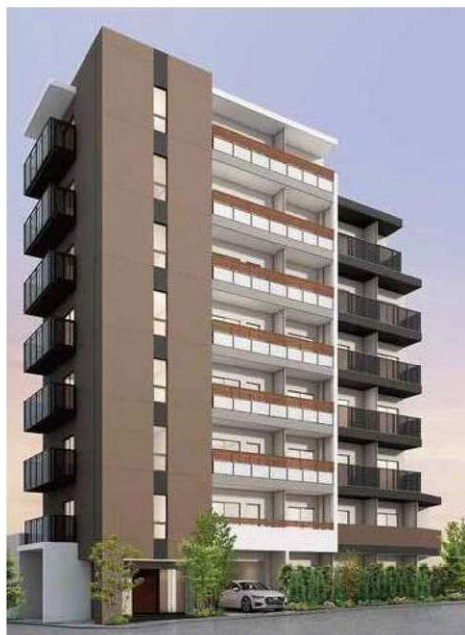
※実際賃貸保証会社との契約が必要です ※本図と現状が異なる場合は現況優先といたします。 ※法人契約で保証会社のご利用がない場合、敷金2ヶ月となります。